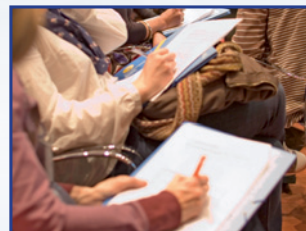
IDEAS PARA LLEVAR.