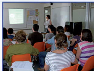
EXPERIENCIAS POR COMPARTIR,