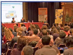
RAZONES PARA VENIR,